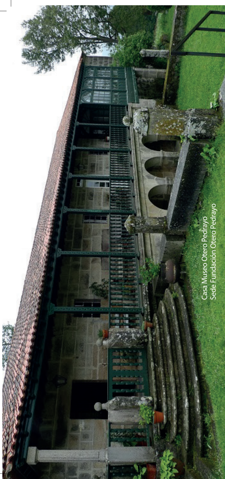
Casa Museo Otero Pedrayo Sede Fundación Otero Pedrayo