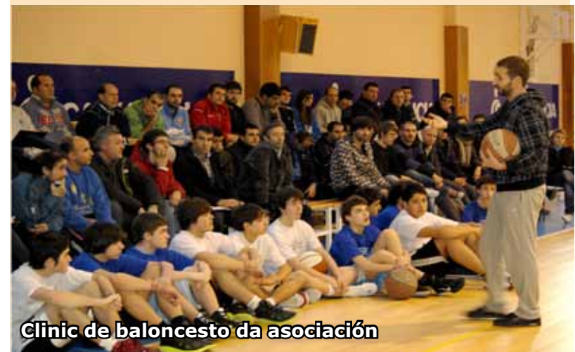
Clinic de baloncesto da asociación

Entre finais de xuño e comezos de xullo prevén un campus multideporte con oitenta prazas, que se une ás xornadas técnicas con Sito Alonso celebradas en abril.