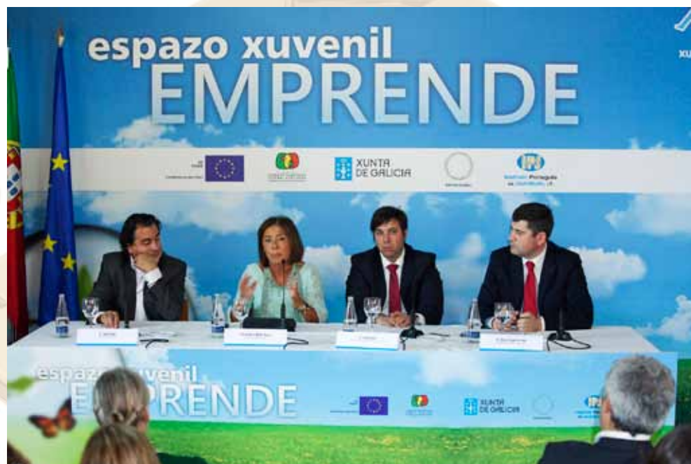
Presentación en Tui do programa Emprende

O anterior programa axudou a crear dez empresas por parte de mozos e mozas e o novo, cun orzamento de 720.000 euros dentro do programa de cooperación transfronteiriza, poderá beneficiar ata 20.000 persoas. As distintas accións que se acometerán servirán para difundir os valores do emprendemento, fomentar a internacionalización das empresas e mellorar a súa competitividade, darlle un novo pulo á formación continua, e en definitiva alentar “a confianza e o estímulo á xuventude como capital de futuro”,