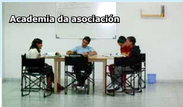
Academia da asociación

pacidade. Contribúen así a preservar a igualdade de oportunidades e a evitar a exclusión social mediante algo tan necesario como a formación persoal. Os resultados están sendo moi satisfactorios.