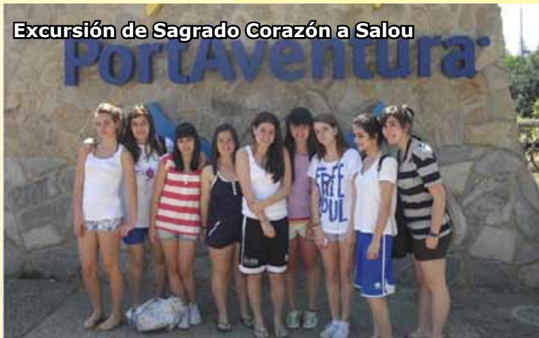
Excursión de Sagrado Corazón a Salou

Deste xeito, no seu calendario teñen como celebracións fixas a festa de reis, o entroido e un magosto popular con castañas que eles mesmos apañan. Tamén pretenden consolidar un concerto que na primeira edición xa contou con grupos como Smiling Drops