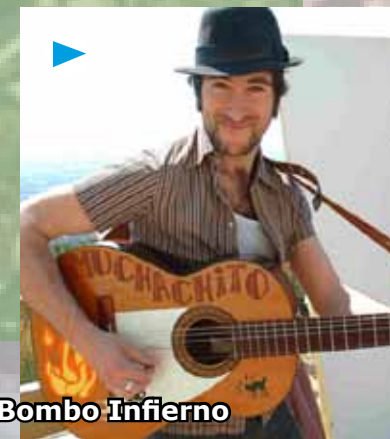
Muchachito Bombo Infierno

para os tres días e con camping a 55 euros por persoa. Están dispoñibles en La Región e na tenda Peggy Records , en Ourense, e en Don Disco Lugo . En internet, unha das opcións con menos recargo é Musikaze .