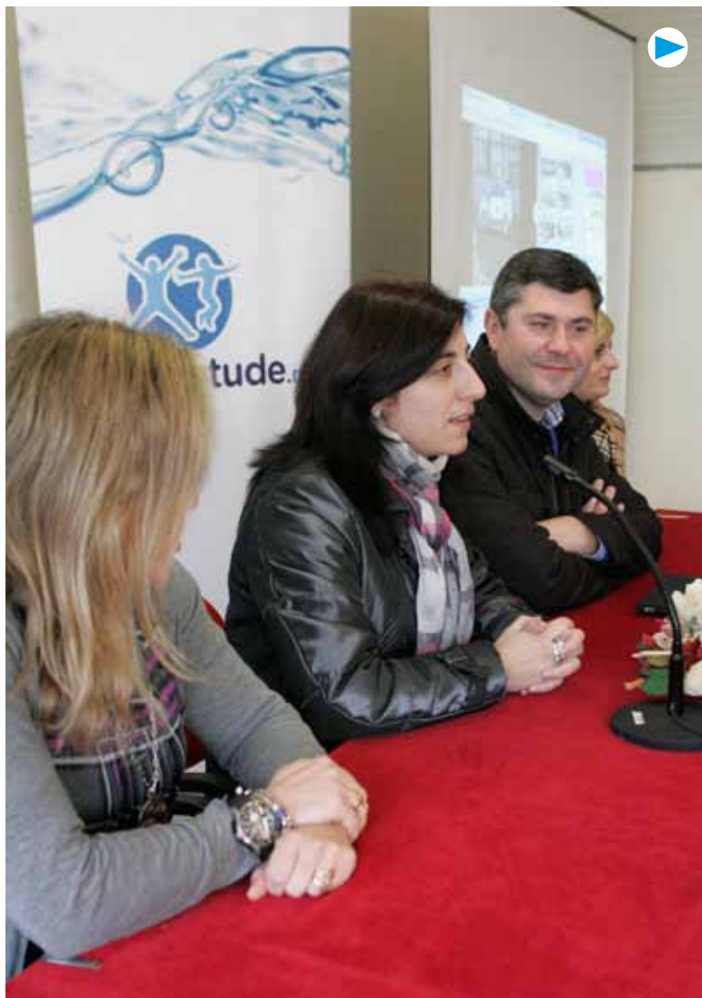
Encontro informativo de Iniciativa Xove en Melide

O propio director xeral de Xuventude e Voluntariado, Ovidio Rodeiro, acudiu a algúns destes actos informativos, para coñecer de primeira man como acollen o programa os seus destinatarios e que intereses e necesidades teñen.