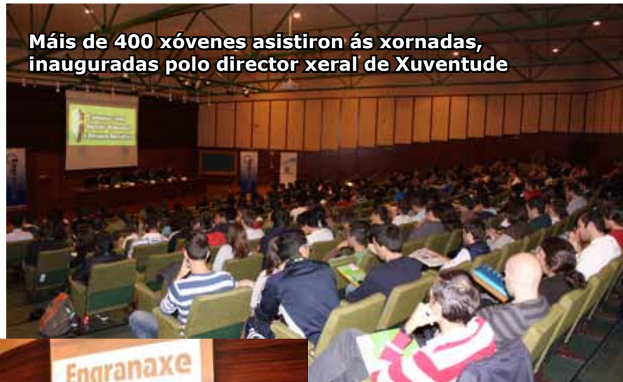
Máis de 400 xóvenes asistiron ás xornadas, inauguradas polo director xeral de Xuventude

Técnicos de empresas, profesores especialistas en enerxía e alumnos da Universidade de Vigo foron os encargados de disertar sobre novos métodos para aproveitar con máis eficiencia os recursos enerxéticos. Centráronse especialmente nas aplicacións no mundo do automóbil e da industria. Pero as conferencias e debates tamén abordaron a utilización de enerxía eólica e fotovoltaica en espazos urbanos, o aproveitamento da biomasa, os retos formativos que supón o vehículo eléctrico para os novos enxeñeiros, ou as posibilidades de emprego xuvenil asociado ás enerxías limpas.