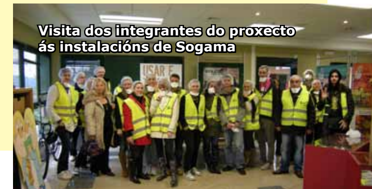
Visita dos integrantes do proxecto ás instalacións de Sogama

Unha trintena de mozos e mozas portugueses, gregos, búlgaros, húngaros e españois participaron nun encontro en Boqueixón no que analizaron o cambio climático e o papel que a xuventude europea ten ante el. Esta actividade inscíbese en Xuventude en Acción , un programa europeo de educación non formal xestionado pola dirección xeral de Xuventude. Durante unha semana, os participantes desenvolveron obradoiros, video fóruns, unha campaña de concienciación ambiental, e visitas a Meteogalicia e Sogama . O director xeral de Xuventude, Ovidio Rodeiro, explicou que se trata dun proxecto que desenvolve a asociación xuvenil Muiños, creada para potenciar a participación social dos mozos e mozas de Boqueixón. Rodeiro lembrou que en 2010 aprobáronse 56 iniciativas no programa Xuventude en Acción e que Galicia é a cuarta autonomía en número de proxectos aprobados, só superada por Andalucía, Cataluña ou Madrid, calquera das tres co triple ou o cuádruplo de poboación.