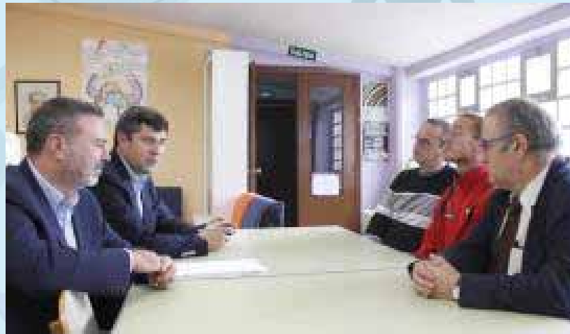
Ovidio Rodeiro, na súa visita á asociación Aspronaga

tude e Voluntariado, Ovidio Rodeiro, visitou nas últimas semanas algúns dos proxectos subvencionados e destacou o carácter “novidoso, pioneiro e experimental a nivel de todo o Estado” do servizo de voluntariado xuvenil, que naceu coa finalidade de formalizar a acción voluntaria.