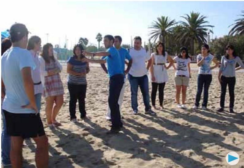
Esta edición duplica o número de alternativas

Volve A Xuventude no Mundo . O programa de intercambios xuvenís da dirección xeral de Xuventude chega á terceira edición, con catorce destinos diferentes. En realidade, dúplícanse as posibilidades de escoller, porque en 2010 foran sete as alternativas. Así, o que o ano pasado se artellou como un programa experimental tivo tan boa acollida que ten xa garantida a continuidade como unha das propostas máis interesantes para os mozos e mozas galegos.