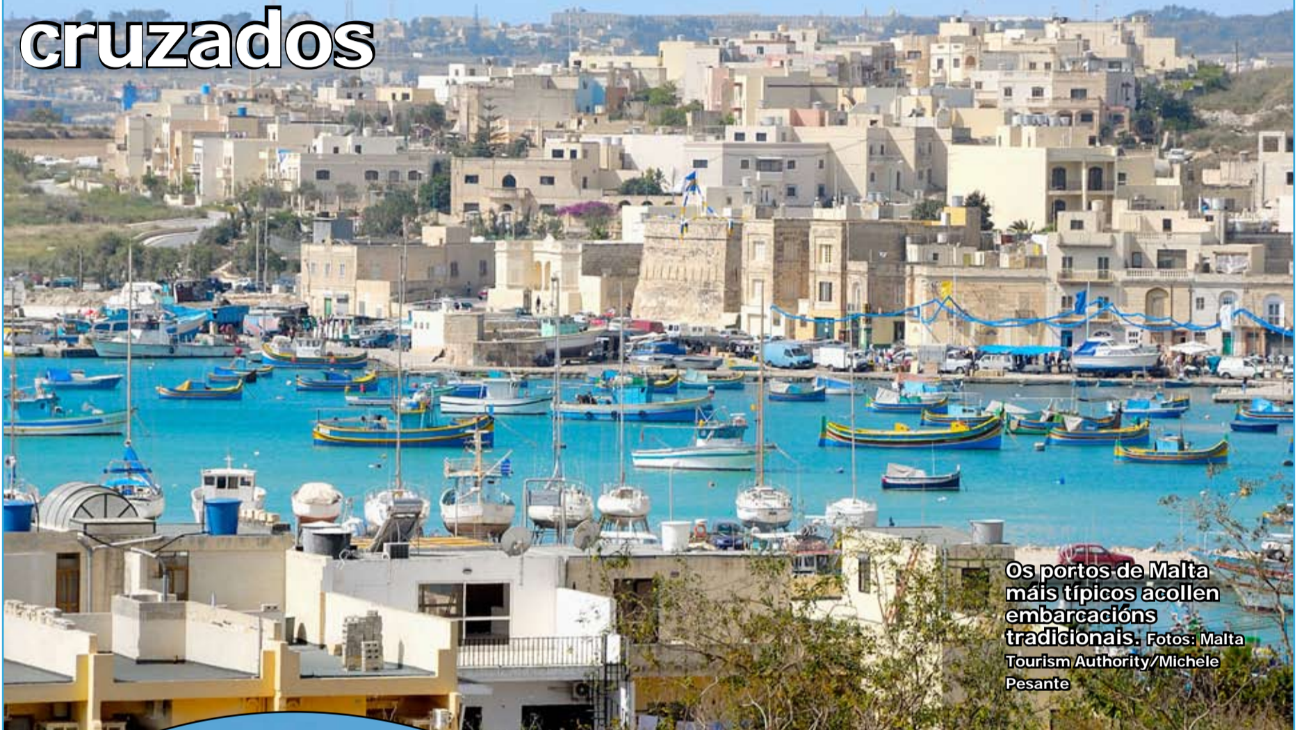
Os portos de Malta máis típicos acollen embarcacións tradicionais.