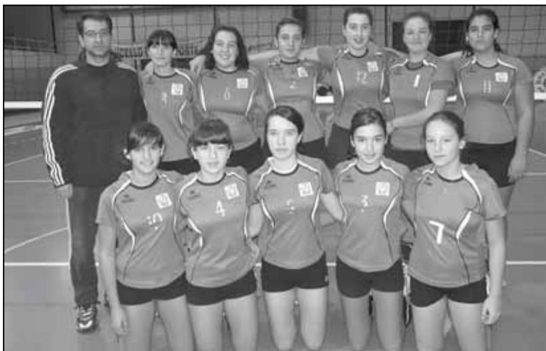
A Pinguela gañou varios campionatos de España en categorías inferiores. Na fotografía, o seu equipo infantil desta campaña