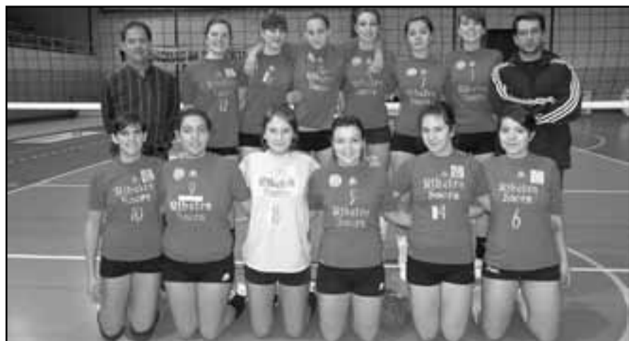
Equipo cadete da Pinguela