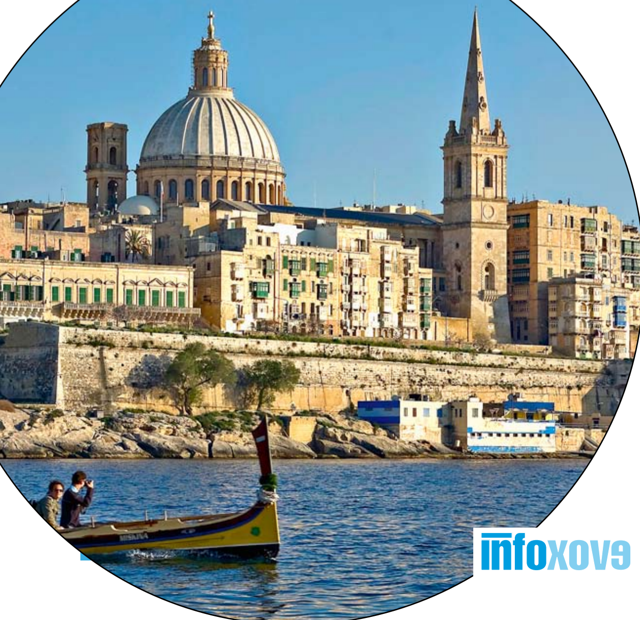
Valletta, vista dende o porto Marsamxett.

As illas de Malta, Gozo e Comino son o destino ideal para facer unha escapada na procura de praias e lugares cheos de encanto e historia