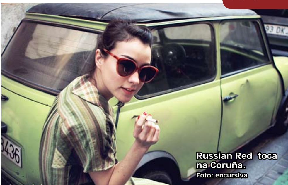
Russian Red toca na Coruña.