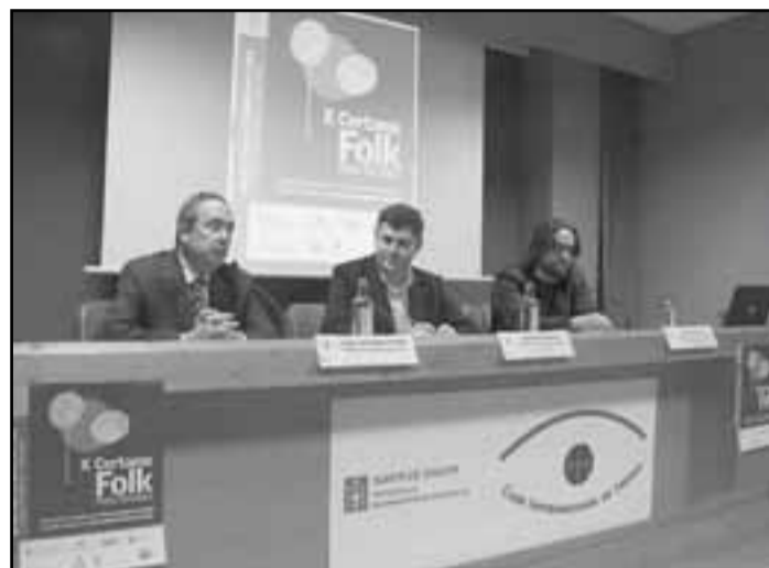
Un momento da presentación

O certame dividiuse en tres seccións, e a modalidade estrela é a de curtametraxes, na