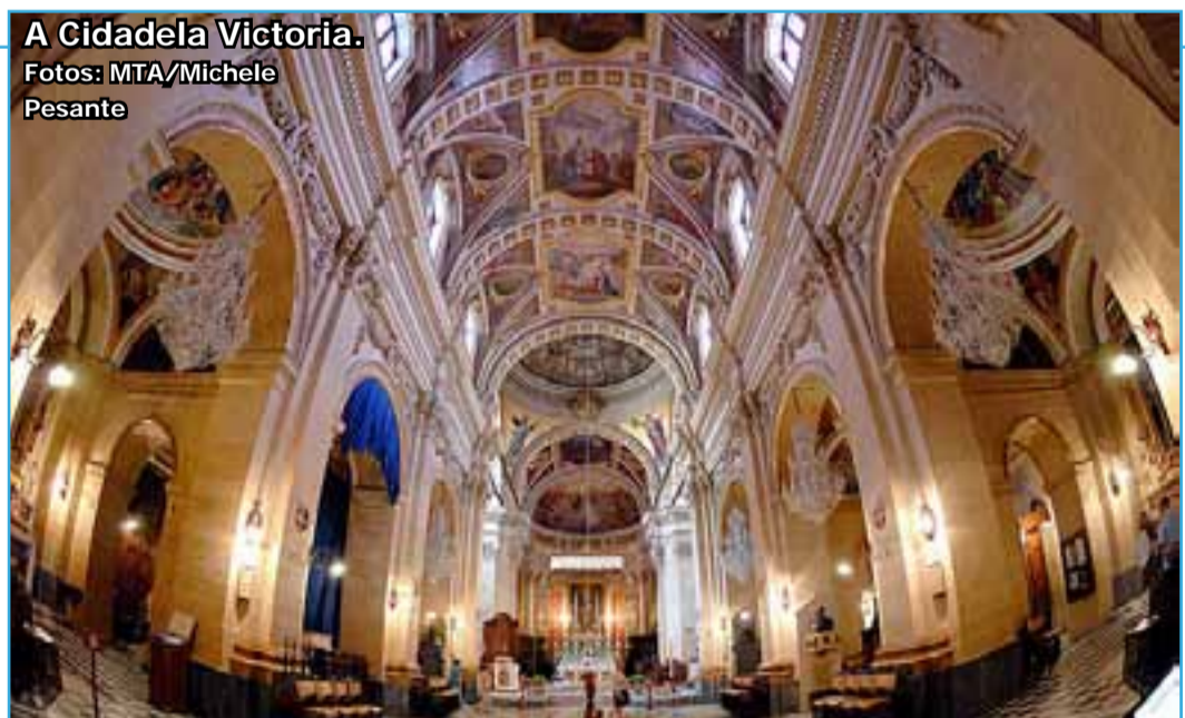
A Cidadela Victoria.

Falemos de idiomas. Os oficiais son o inglés e o maltés, aínda que tamén hai moita xente que fala o italiano. O país está densamente poboado e non faltan os lugares con aglomeracións de xente compensadas por recunchos cheos de paz, como as aldeas de pescadores nas que pasar un bo rato, coñecer os costumes e probar a gastronomía local. Queda claro que unha visita a Malta paga a pena.