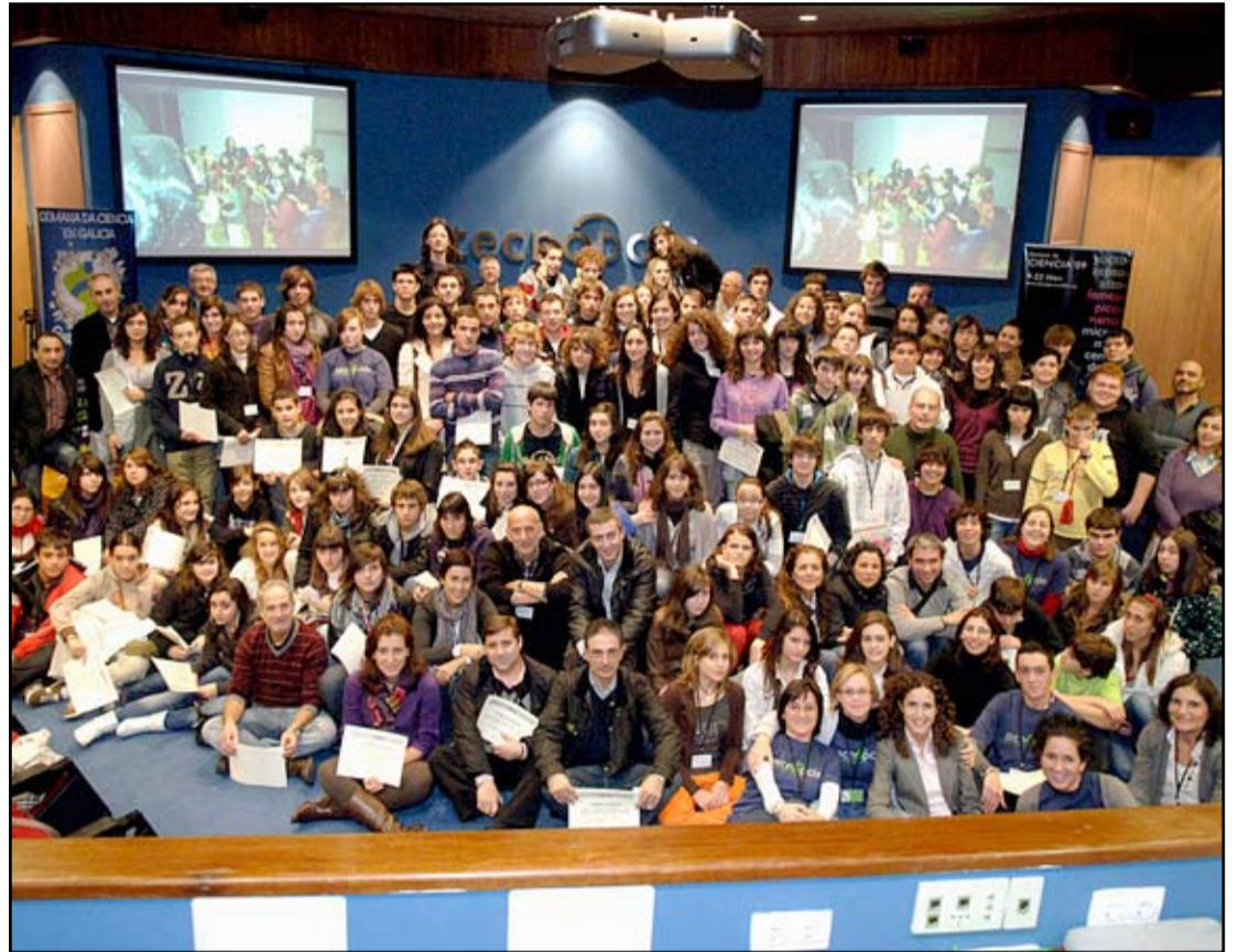
A cuarta edición do certame acolleu a presentación de medio cento de proxectos elaborados por alumnos de secundaria

"O premio absoluto permitiralles viaxar a Barcelona para participar na próxima edición da Exporecerca, a feira científica análoga a Galiciencia en Cataluña"