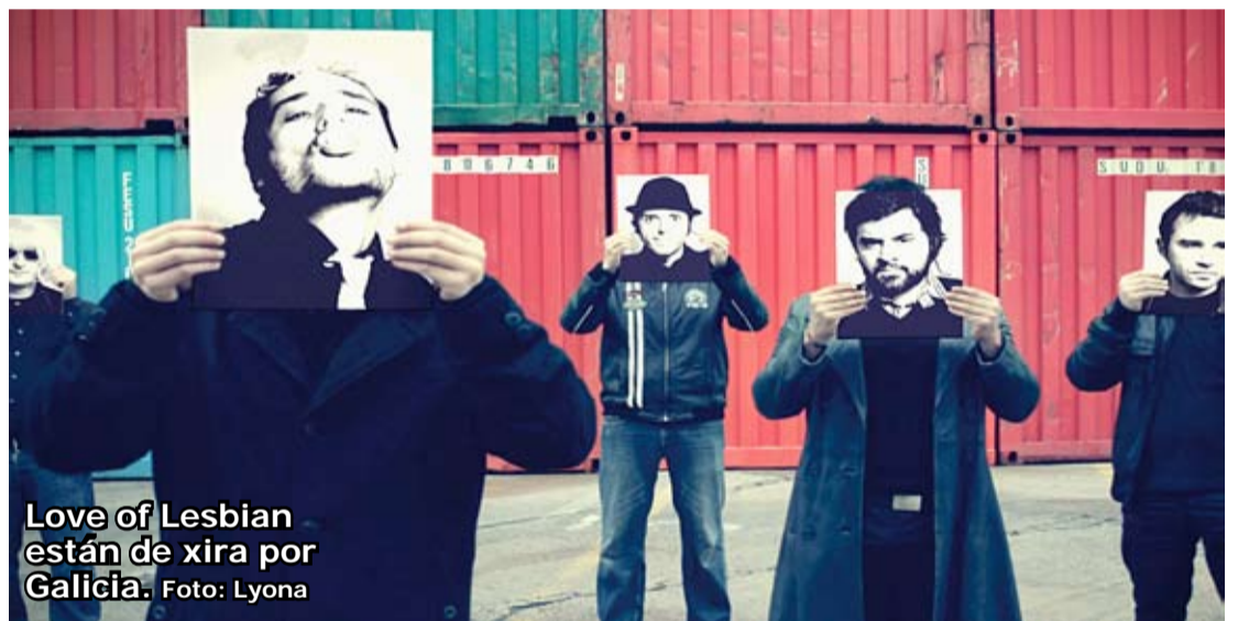
Love of Lesbian están de xira por Galicia.