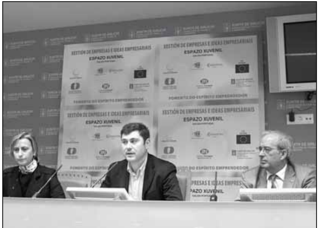
Na presentación salientouse a importancia dos mozos emprendedores

Todas as accións son de balde. A iniciativa continuará no 2010