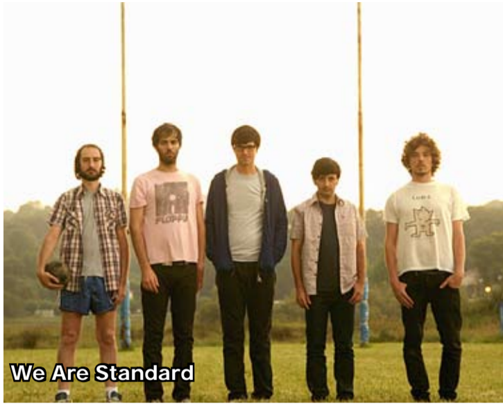
We Are Standard

18 de decembro CARLOS NÚÑEZ Centro Cultural Caixanova 19 de decembro DINERO La Fábrica de Chocolate 19 de decembro ROMASANTA Contrabajo 19 de decembro NACH+ZPU+ABRAM Mondo 19 de decembro PROUD+AGAINST THE SPIRITS La Iguana 20 de decembro RESERVA IDEA ROCK Mondo 26 de decembro SAMUEL LEVI+CAABA+BLUE JEANS Mondo 2 de xaneiro MUNICH+SALLY SAID SO+ANESOME Mondo 9 de xaneiro MARCHA POLA PAZ FESTIVAL Mondo 20 de novembro CON MORA La Iguana Club ARKANOS Mogambo 28 de novembro GOSE La Iguana Club 28 de novembro POËM Contrabajo 30 de novembro CIRCLE MARCO 5 de decembro MARYLAND + MUY FELLINI Fábrica de Chocolate Club 5 de decembro EL DESVÁN DEL DUENDE Mondo