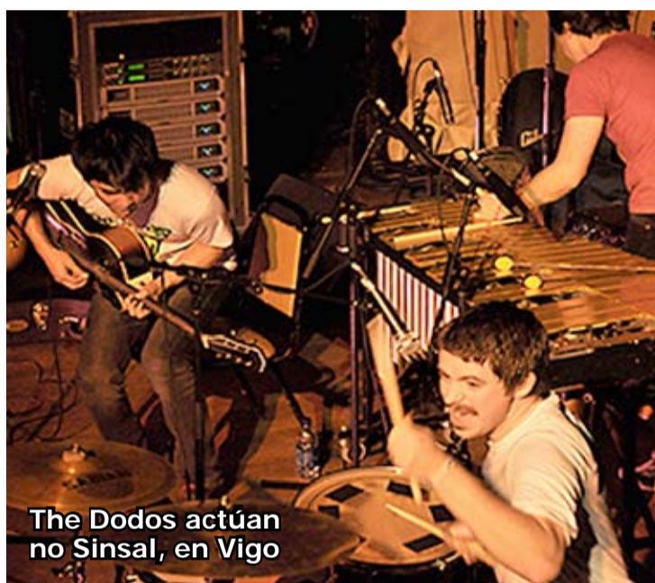
The Dodos actúan no Sinsal, en Vigo