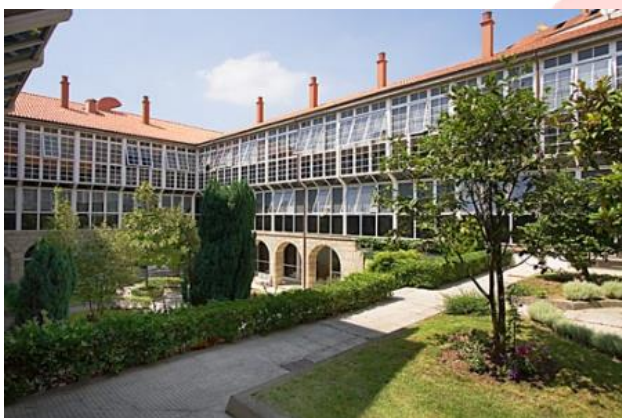
Imaxe da Residencia Florentino López Cuevillas (Ourense)

A Dirección Xeral de Xuventude, Participación e Voluntariado, dispón de instalacións que durante o curso académico funcionan como residencias xuvenís. Como é habitual as ditas instalacións póñense a disposición dos mozos/as estudantes, reservando un 9% das prazas para a mocidade traballadora e resérvase tamén un 9% para o caso de mozas que sufran violencia de xénero ou para mozos e mozas cuxas proxenitoras a sufrisen.