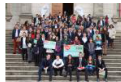
Vilagarcía de Arousa e o IES Monte Castelo de Lugo.

O equipo do IES de Becerreá , na categoría de Bacharelato, e o do colexio La Salle , na modalidade de ESO, resultaron hoxe gañadores de Parlamento Xove 2015 , unha iniciativa organizada anualmente pola Consellería de Traballo e Benestar . O director xeral de Xuventude e Voluntariado, Ovidio Rodeiro , presidiu, no Parlamento galego, a final deste concurso no que participaron 43 equipos de 37 centros educativos de toda Galicia, cun total de 215 alumnos e alumnas. Á final chegaron 16 equipos de 14 centros.