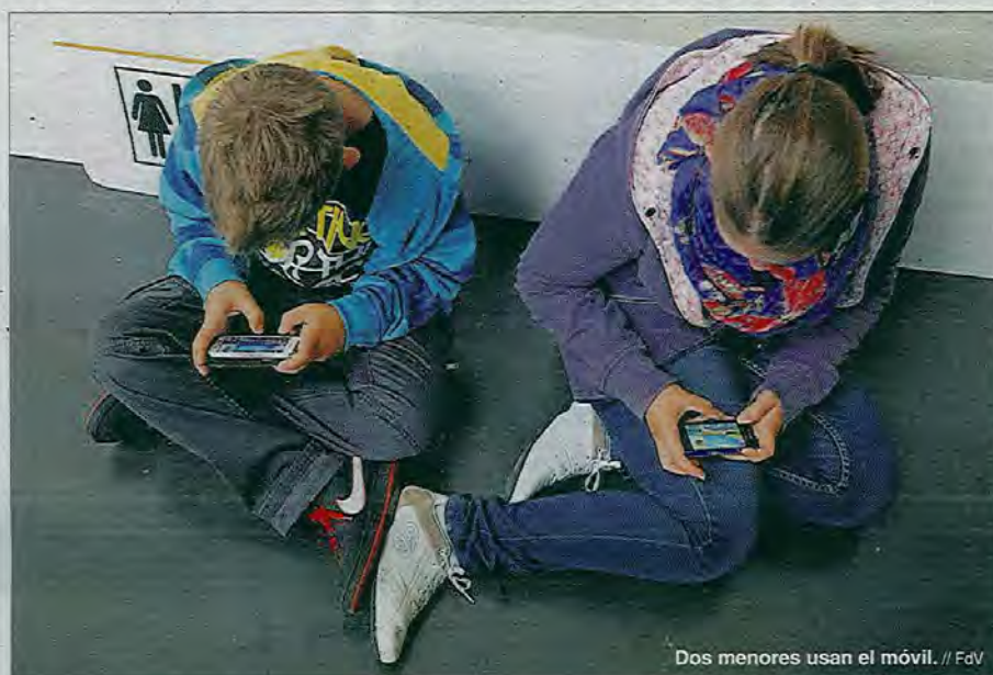
Dos menores usan el móvil.

La Fiscalía General del Estado ponía el acento recientemente en un aumento "espectacular" de los abusos entre menores. Es decir, no necesariamente siempre es un adulto el que se aprovecha de un niño o un adolescente. De hecho, cada vez hay más menores que se