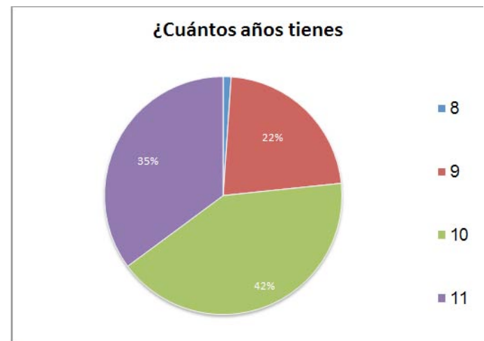
Figura 1: Porcentajes de la edad de niños y niñas (de 8 a 11 años)

La muestra se compone de 561 menores y es una muestra muy equilibrada, de los encuestados, un 51% son niños y un 49% son niñas de diferentes edades comprendidas entre 8 y 11 años, de los cuales un 42%, tiene 10 años, un 35% 11 años, un 22% 9 años y 1% 8 años (ver Figura 1). Un 60% de los encuestados/as han jugado o juegan al Fortnite (ver la Tabla 1) y en la misma proporción, a un 60% de los menores les gustan los videojuegos de lucha. También se ha observado que un 83% de los encuestados/as juegan con amigos/as o compañeros/as de colegio y que el 74.6% dicen que juegan solamente los fines de semana y festivos, el otro 25,5% juega tanto los fines de semana como durante la semana.