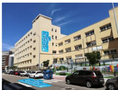
Residencia Altamar en Vigo