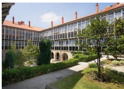
Residencia Florentino López Cuevillas en Ourense