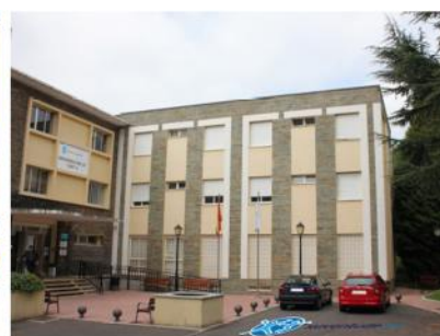
Residencia Lug II en Lugo

A Consellería de Política Social e Xuventude convoca a adxudicación de prazas e de bolsas nas súas residencias xuvenís.