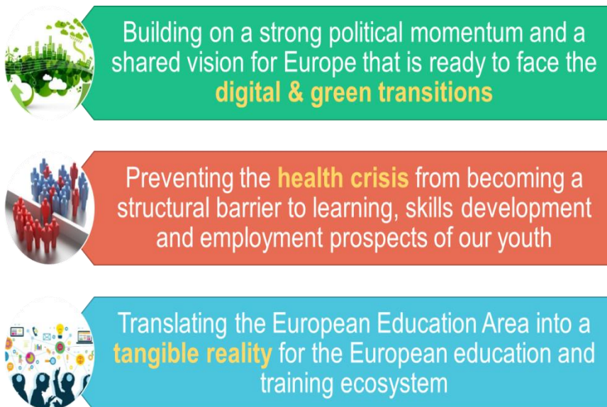
Ilustración: consecución del Espacio Europeo de Educación

Ha sido prioritario contribuir a mejorar la empleabilidad de los jóvenes y apoyar la meta respecto a la juventud europea de un « Empleo de calidad para todos ». En las Conclusiones sobre los jóvenes y el futuro del trabajo 15 del Consejo, se determinaron medidas correctoras para las condiciones de trabajo precarias a las que se enfrentan los jóvenes, como una seguridad social y unos sistemas de educación y formación con capacidad de respuesta, la promoción del aprendizaje permanente, una transición fluida de la escuela al mercado laboral y las transiciones dentro de este, así como el acceso igualitario a empleos de calidad para todos los jóvenes.